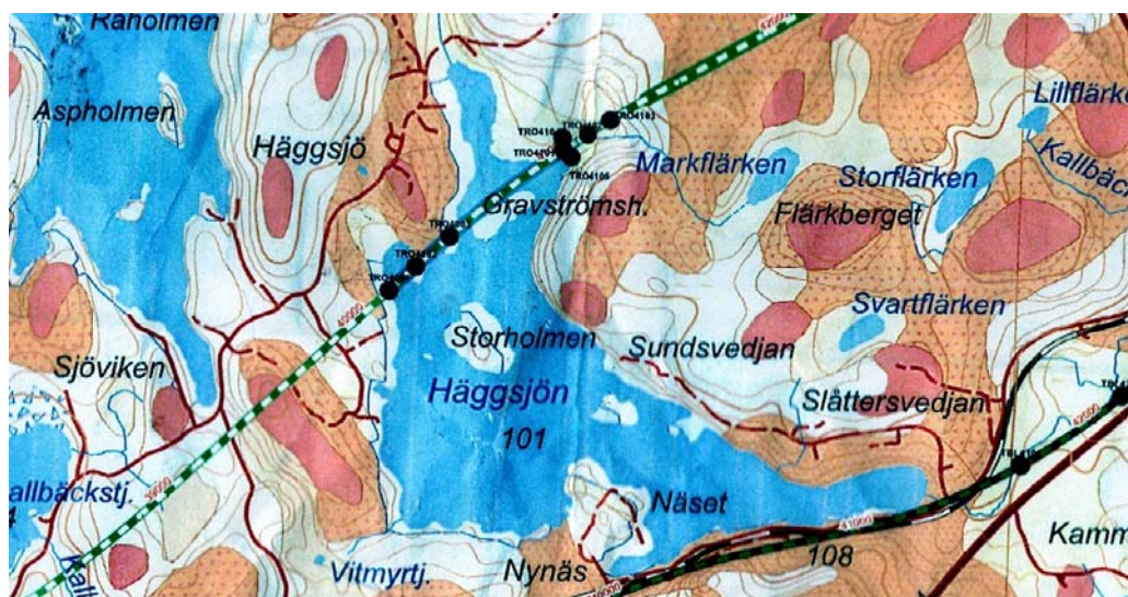
Föreslagen dragning med markerade punkter för provborring

En sommarcykelväg på Norrstigen tycker väl alla är enbart positivt, men en ny sträckning av järnvägen som drar från Kallbäcken och rakt över norra delen av Häggsjön och in i en tunnel mot Mark, är ett hot som definitivt känns olustigt.